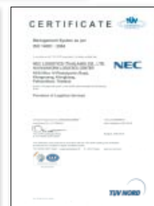
海外ISO認定登録(シンガポール、台湾、タイ、フィリピン、深圳)