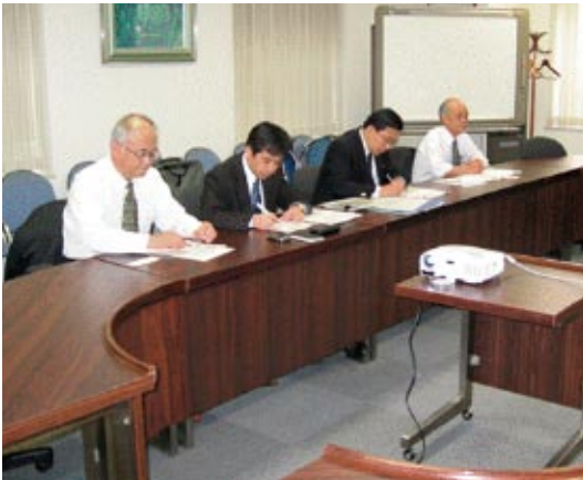
協力会社環境交流会

輸送業務を委託している主要協力会社と2006年度からトラックCO 2 削減、法順守、オイル漏れの緊急対応並びに環境活動に関わる取組み等について情報交換を行っています。