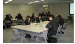
一般教育(新入社員)