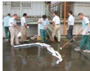
燃料漏れ訓練(静岡支店)

輸送トラックの公道、拠点構内での燃料、エンジンオイルの漏洩が発生したことを想定し全拠点を対象に訓練を行っています。