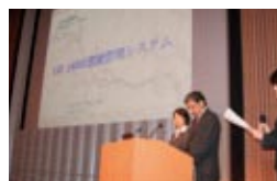
ISO取得活動(海外法人)