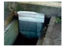
オイルフェンス (構外流出防止)