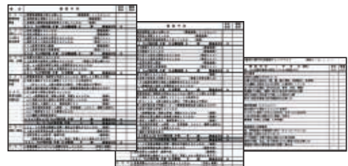
拠点監査用チェックリスト

事業部が監査計画を作成し監査チームを編成します。監査は運用編と活動編（パフォーマンス）のチェック表を使用し、まず被監査部門が自主評価を行い、それに基づいて監査チームが確認し評点付けを行います。監査結果をまとめ前年度との比較、他拠点との比較により活動の活性化に繋げています。