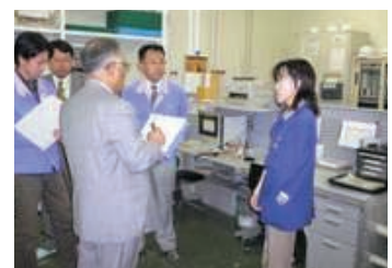
審査機関審査(現場)