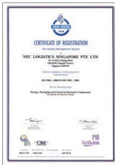
シンガポール登録証