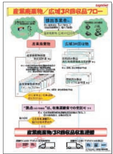
収集運搬ポスター