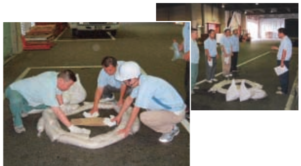
トラックオイル漏れの緊急対応訓練