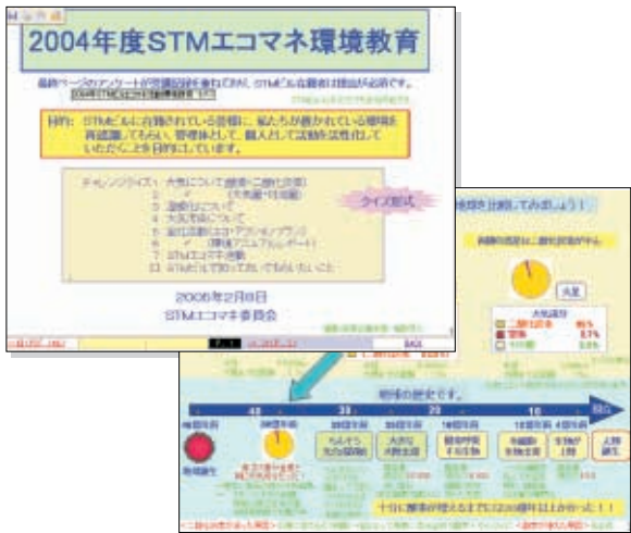
Webによる環境一般教育例