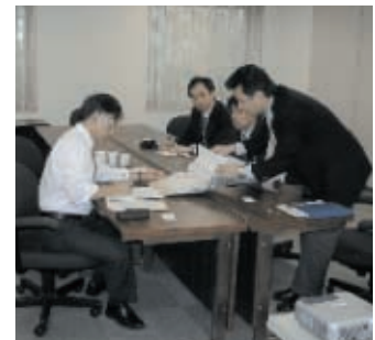
全社・事業部監査