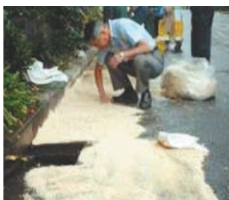
おがくすによる オイル吸収