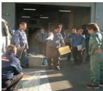
オイル漏れ 想定訓練

緊急時対応として、地域の環境に影響をおよぼす可能性があるトラックの軽油・オイル漏れによる漏出防止については、迅速・的確に対応できるよう、協力会社も参加し、緊急事態対応訓練を各拠点で毎年実施しています。