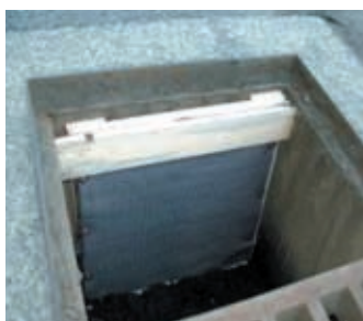
雨水升オイル 吸着マット装着