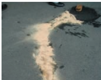
漏出したオイルをおがくすで吸収