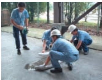
オイル吸収マットで拡散防止