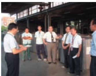
環境管理責任者による講習

地域環境に大きな影響を与える可能性があるトラックからのオイル漏れ・薬品の漏出等、緊急時に迅速・適切に対応ができるよう、各拠点に緊急事態対応訓練を年一回以上行うことを義務づけ、実施しています。