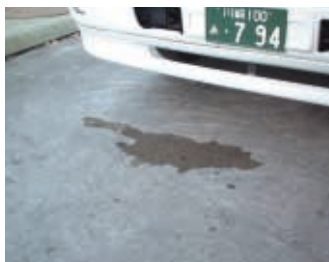
トラックからオイル漏出